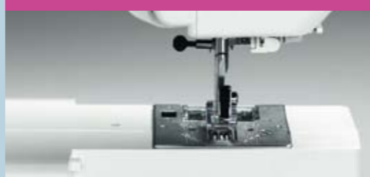
Tout en finesse: pression du pied réglable en 3 positions.