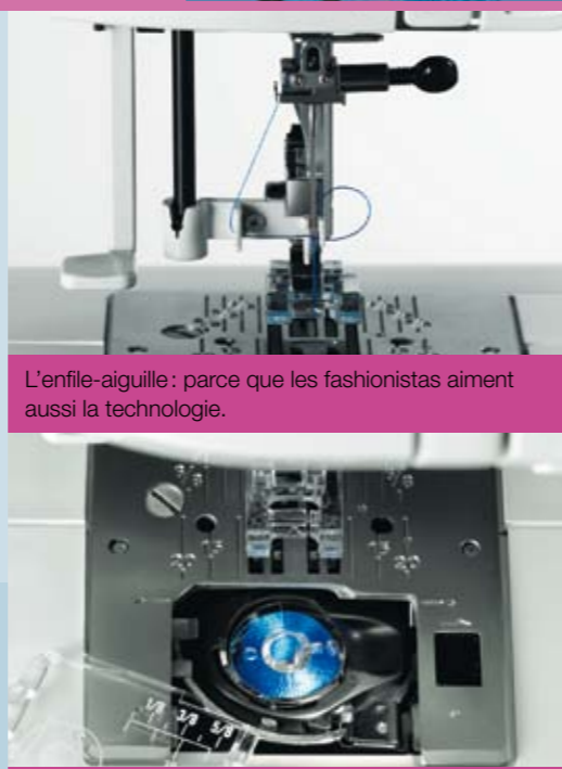
L'enfile-aiguille: parce que les fashionistas aiment aussi la technologie.